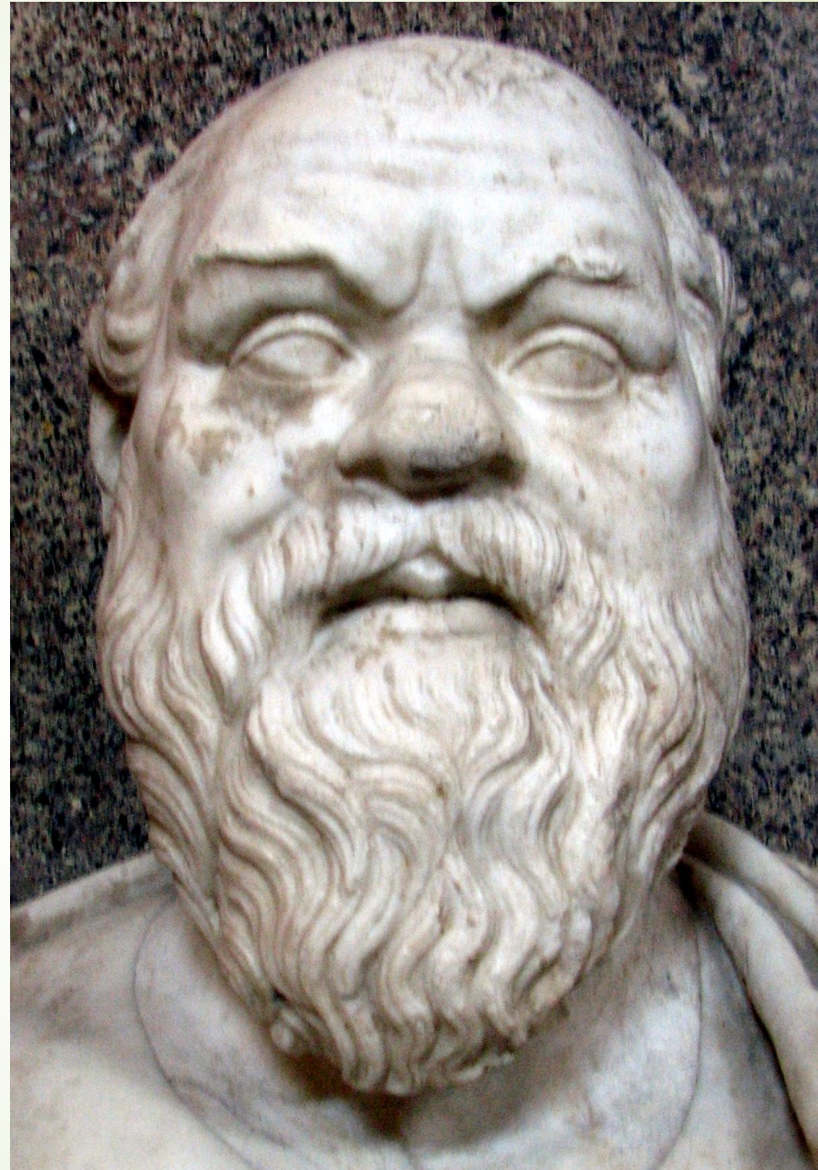
Sokrates - popiersie z Muzeum Watykańskiego