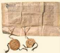
Akt unii horodelskiej z 1413 r. ustanawiał szczegółowe rozwiązania ustrojowe, które miały obowiązywać w państwach polskim i litewskim. Pergaminowy dokument został spisany po łacinie. U dołu przytwierdzono dwie pieczęcie: Władysława Jagielly i Witolda. Dokument jest przechowywany w zbiorach Muzeum Książąt Czartoryskich w Krakowie.

Stosunki polsko-litewskie ostatecznie ukształtowały się w 1413 r. na zjeździe w Horodle, w którym uczestniczyli Jagiello, Witold oraz panowie polscy i litewscy. Zawarli oni pakt zwany unią horodelską. Litwa miała oddać posiadacz odrębnego władcy, podlegającego królowi polskiemu. Wielkiego księcia wyznaczał król w porozumieniu z radą panów świeckich i duchownych obu państw. Ponadto po śmierci Jagielly wybór jego następcy wymagał zgody wielkiego księcia oraz panów litewskich. Dodatkowo w Horodle postanowiono, że choć na tronach obu państw zasiadałi odrębni władcy, unia będzie obowiązywać także po wygaśnięciu dynastii Jagiellonów.